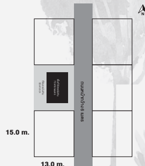
Plan C ขนาดที่ดิน 15x13 เมตร